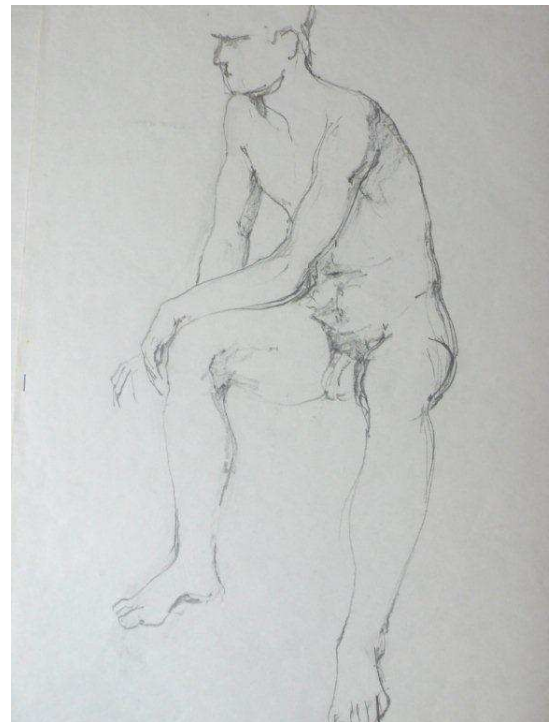
Etude de Nu anatomie